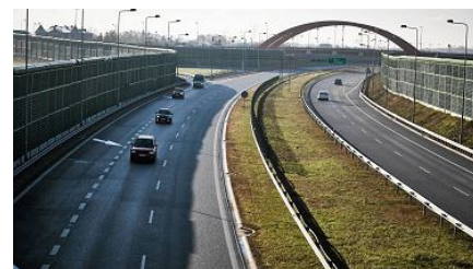
Powstanie droga S14. Tak będzie wyglądał ring wokół Łodzi [MAPY]