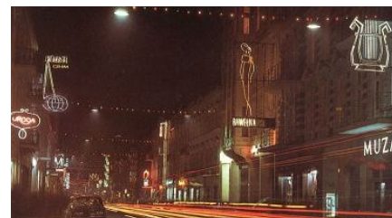
Piotrkowska sprzed lat pełna kolorowych neonów [ARCHIWALNE ZDJĘCIA]