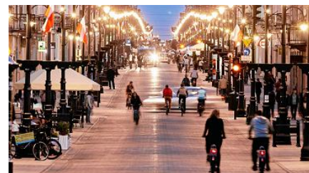
Piotrkowska, królowa polskich ulic [REPORTAŻ MULTIMEDIALNY]

Promocja rozpoczęła się dziś o godz. 13.30 i potrwa do 28 lutego, chyba że bilety skończą się wcześniej. Pasażerowie mogą kupić bilet za złotówkę na trasie ŁKA do Łowicza, Kutna, Sieradza, Skierniewic i Warszawy. Bilety są dostępne wyłącznie na platformie koleo.pl. Kupując taki bilet można zaoszczędzić nawet 23 złote (bo bilet do stolicy w cenie regularnej kosztuje 24 złotych).